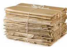
Piegati ed imballati